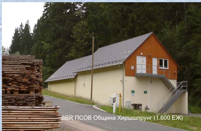
SBR ПСОВ Община Хиршшпрунг (1.600 ЕЖ)