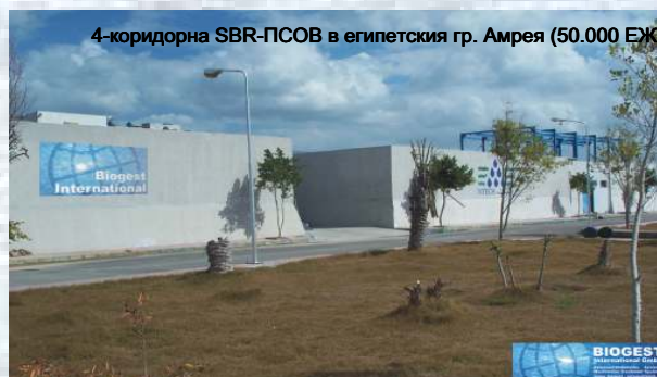
4-коридорна SBR-ПСОВ в египетския гр. Амрея (50.000 ЕЖ)