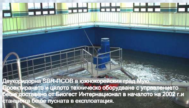
Двукоридорна SBR-ПСОВ в южнокорейския град Мую. Проектирането и цялото техническо оборудване с управлението беше доставено от Биогест Интернационал в началото на 2002 г. и станцията беше пусната в експлоатация.