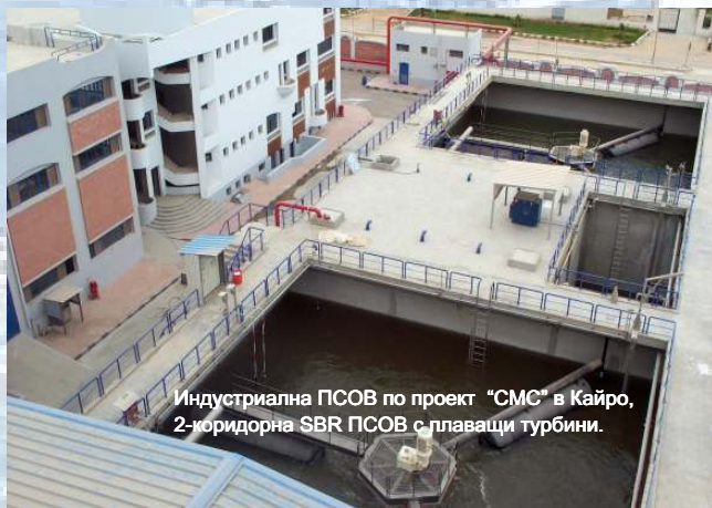
Индустриална ПСОВ по проект "СМС" в Кайро, 2-коридорна SBR ПСОВ с плаващи турбини.