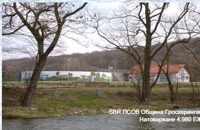
SBR ПСОВ Община Гросхеринген Натоварване 4.980 ЕЖ

Изброените референции представляват малка извадка от пълния списък с референции, които са свързани с понятието "Биогест" . Ние сме готови и с удоволствие можем да посочим специални инсталации или ПСОВ в определени райони и съответно да ги посетим заедно при интерес.