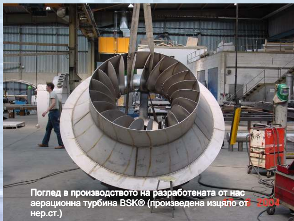
Поглед в производството на разработената от нас аерационна турбина BSK® (произведена изцяло от нер.ст.)