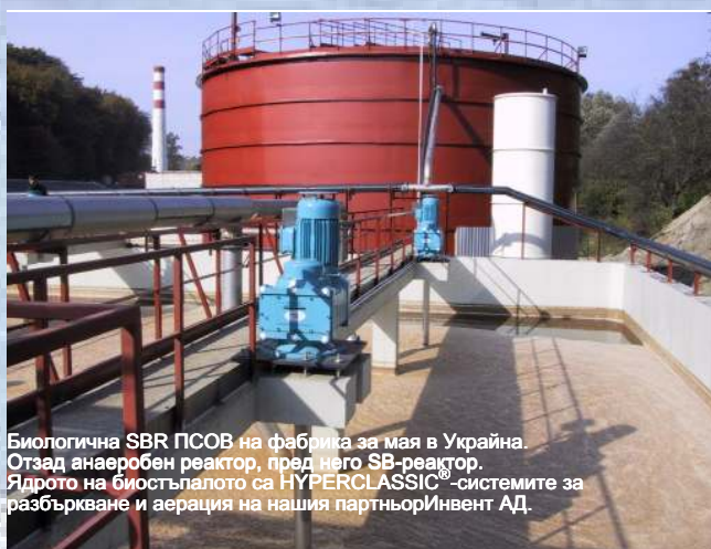
Биологична SBR PCOV на фабрика за мая в Украйна. Отзад анаеробен реактор, пред него SB-реактор. Ядрото на биостъпалото са HYPERCLASSIC®-системите за разбъркване и аерация на нашия партньор Инвент АД.