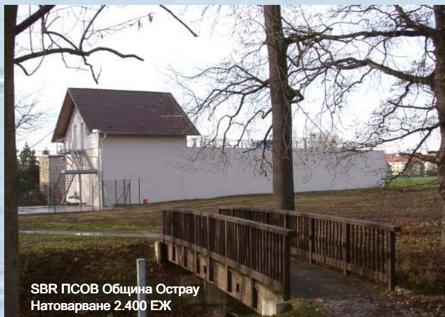
SBR PCOV Община Острау Натоварване 2.400 ЕЖ