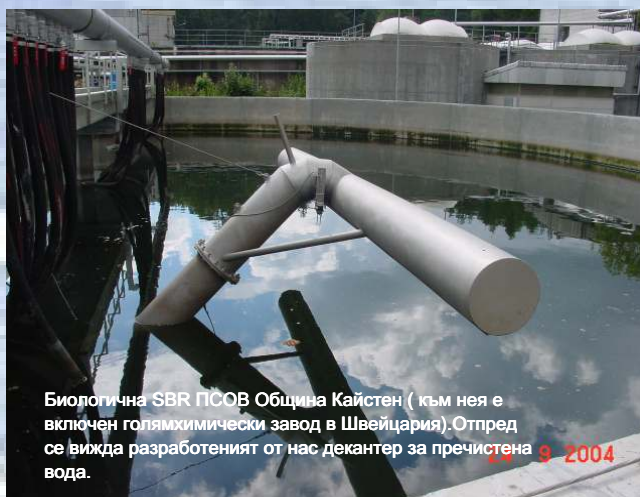
Биологична SBR PCOV Община Кайстен (към нея е включен голям химически завод в Швейцария). Отпред се вижда разработеният от нас декантер за пречиствена вода. 9 2004