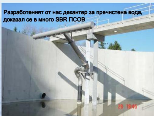
Разработеният от нас декантер за пречистена вода, доказал се в много SBR ПСОВ