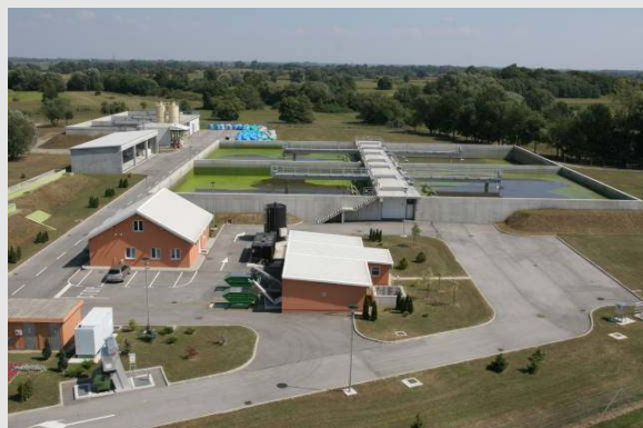
Vogelperspektive auf die Kläranlage der Stadt Koprivnica (100.000 EW), welche von der Biogest International GmbH entworfen und realisiert wurde und welche nach der SBR-Betriebsweise (4 Reaktoren) arbeitet.