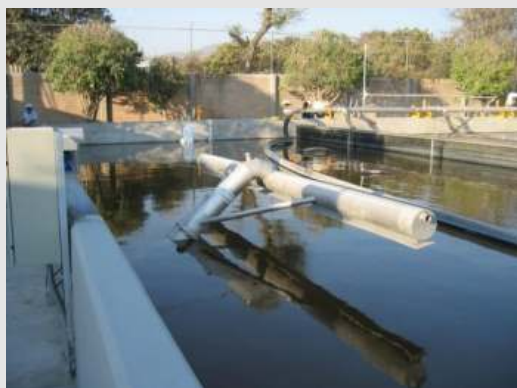
BSK®-Klarwasser-Dekanter installiert in einer Kläranlage in Mexiko