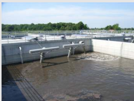
Der wartungsfreie BSK®-Dekanter ist in vielen SB-Reaktoren mit großem Erfolg im Einsatz.