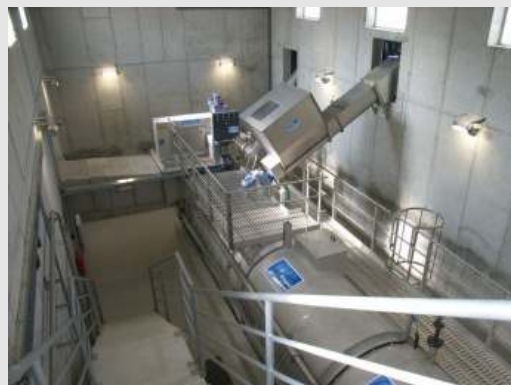
Vorklärstation der Kläranlage Koprivnica (max. hydraulische Leistung = 1.600 m 3 /h).