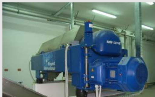
Hochleistungs-Schlammwässerungszentrifuge mit einer Leistung von 25 m 3 Schlamm pro Stunde. Das Entwässerungsergebnis beträgt > 25 % TS.