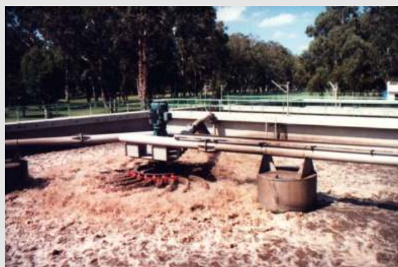
BSK®-Oberflächenbelüfter der SBR-Kläranlage der mexikanischen Stadt Celaya.