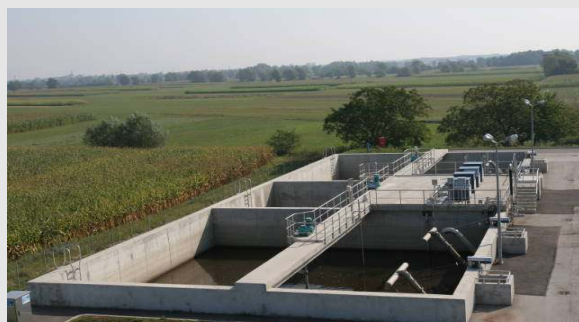
Kläranlage der kroatischen Stadt Virje (5.000 EW) mit zwei SB-Reaktoren, komplett entworfen und ausgestattet von der Biogest International GmbH.