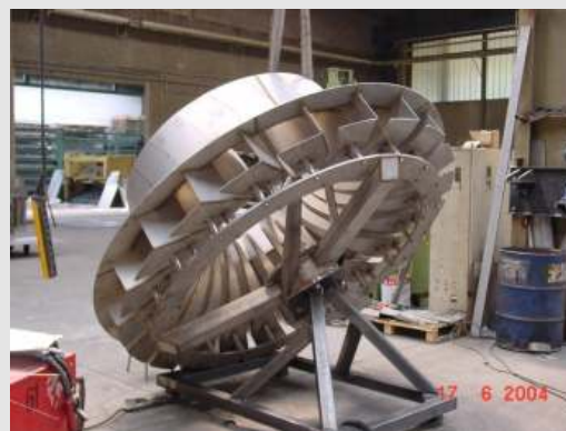
BSK®-Oberflächenbelüfter während der Herstellung im Biogest-Betrieb.