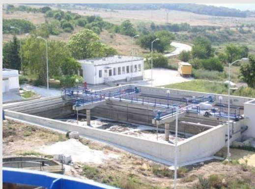
Biogest-Kläranlage von der bulgarischen Stadt Beloslav (20.000 EW).