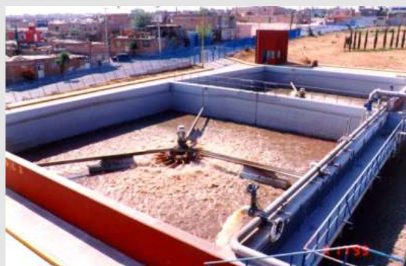
Seit 1995 arbeitet die Kläranlage für die eine mexikanische Stadt (Aguascalientes) basierend auf der Technologie der Biogest International GmbH (schwimmende Belüfter in insgesamt 5 SB-Reaktoren). Der Anschlusswert liegt bei 40.000 EW.