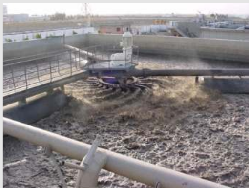
BSK®-Oberflächenbelüfter einer Kläranlage bei Alexandria