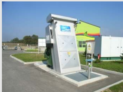
Automatischer Grobrechen für die mechanische Vorreinigung von Abwasser. Vollständig hergestellt aus Edelstahl, um eine lange Lebensdauer, keine Korrosion und einen gewissenhaften Betrieb zu gewährleisten.