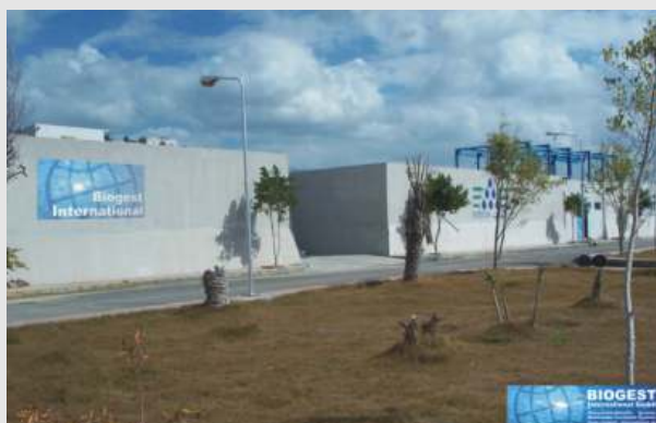
Biogest-Kläranlage der ägyptischen Stadt "Amreya" bei Alexandria. Die hydraulische Leistung liegt zwischen 5.000 – 6.000 m 3 /d, welche mit 3 SB-Reaktoren behandelt wird. Belüften und Rühren erfolgt durch schwimmende BSK ® -Turbinen Ø 2.50 m.